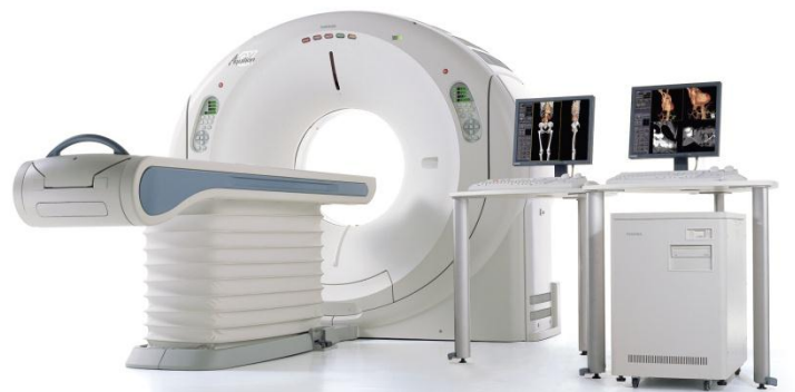
◆当院64列マルチスライスCT装置